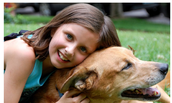
► W nowo wyremontowanych pomieszczeniach będzie się odbywała m.in dogoterapia

cie indywidualnym, pomoc psychologiczna w sytuacji kryzysowej, grupowe wsparcie psychologiczne dla rodziców dzieci niepełnosprawnych, arteterapię, dogoterapia, poradnictwo psychologiczne dla rodziców dzieci z problemami opiekuńczo – wychowawczymi, terapia uzależnień, wsparcie terapeutyczne dla osób z chorobami nowotworowymi.