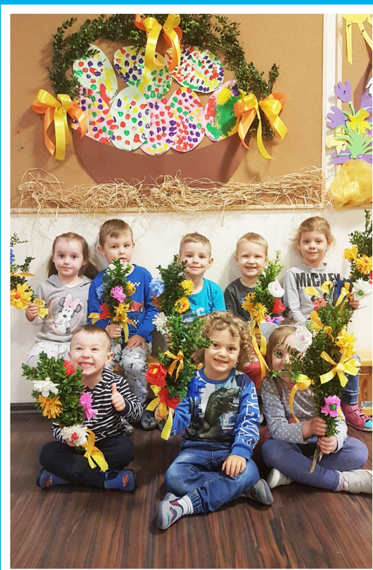
Przygotowania do Świąt Wielkanocnych w Niepublicznym Żłobku i Przedszkolu Nibylandia

WIĘCEJ INFORMACJI NA TEMAT NASZYCH SZKÓŁ