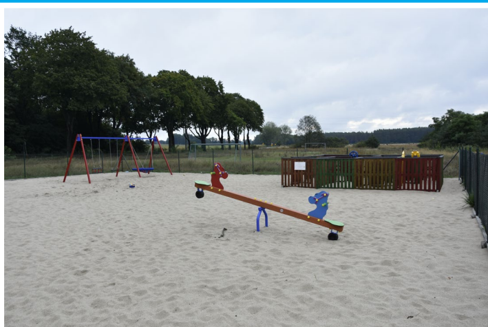
Plac zabaw przy blokach w Letnicy

Na place zabaw miejscowościach czekają zarówno dzieci, jak i ich rodzice. A Gminie zależy aby place były bezpieczne. Dlatego powstają nowe miejsca zabaw, a te istniejące są udoskonalane. Do tej pory dzieci bawiące się na placu zabaw w Buchałowiu chodziły po trawie. Teraz w tym miejscu został wysypany piasek, dzięki czemu najmłodszy mogą się poczuć trochę jak nad morzem. Bezpieczna nawierzchnia pojawiła się też na terenie placu zabaw w centrum Letnicy, gdzie zostanie jeszcze wymienione ogrodzenie. Z kolei przy blokach w tej miejscowości całkiem zmodernizowano miejsce do zabawy. Plac został przesunięty tak, aby znajdował się dalej od drogi, zostały wymienione urządzenia na nowe i bezpieczne, podobnie jak nawierzchnia. Plac jest ogrodzony, niedługo zostaną zamontowane tam ławki. Wszystkie te zadania zostały sfinansowane z budżetu gminy.