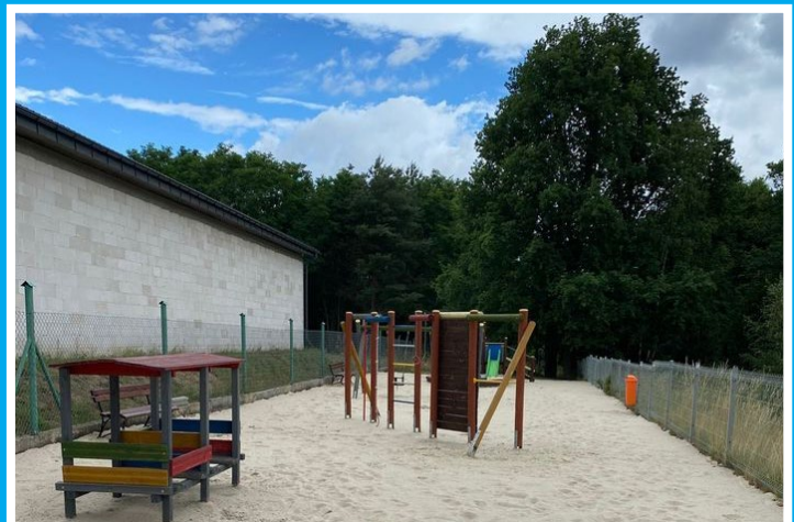
Plac zabaw w Buchałowiu