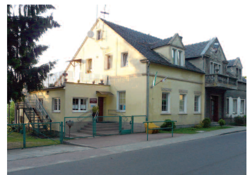
Fot. 7. Restauracja „Pod złotą gwiazdą” znajdowała się w budynku obecnego przedszkola