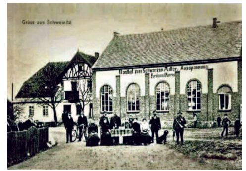
Fot. 2. Restauracja „Pod czarnym orłem” kiedyś

W naszej wędrowce po świdnickich lokalach nie może zabraknąć interesu prowadzonego przez Theo Wolffa, który umiejscowiony był obok dawnej ewangelickiej szkoły. Oprócz działalności gastronomicznej odbywały się tu wszelkiego rodzaju imprezy okolicznościowe, zebrania, a w sobotnie wieczory do tańca grał mały zespół muzyczny złożony z lokalnych muzyków. Obecnie w budynku tym mieści się GOK (fot. nr 9). Czwartą restauracją była „Gasthof Unter den Linden” (Pod lipami) prowadzona przez Alois Zieslar. Mieściła się na skrzyżowaniu obecnych ulic Kościuszki i Drzymały, niestety w 1945 r. została spalona przez pijanych szabrowników, a następnie rozebrana przez okolicznych mieszkańców. Taki wybór mieli dorośli, natomiast dzieci kochały cukiernię i kawiarnię, którą prowadził Albert Petschke. Znajdowała się ona w budynku przy dzisiejszej ul. Długiej. Podawano tu kilka rodzajów ciast owo-