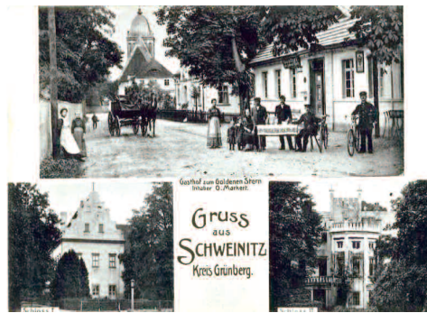
Fot. 8. Restauracja „Pod złotą gwiazdą” i budynki muzeum archeologicznego.

Kolejna restauracja znajdowała się naprzeciwko pałacu rodu Kittlitz (obecnie muzeum) nazywała się „Gasthof zum Goldenen Stern” (Pod złotą gwiazdą), (fot. nr 6, 7, 8). Był to rodzinny interes, którego właścicielem był Olivier Markert. Lokal ten specjalizował się w daniach z dziczyzny, której w okolicznych lasach było pod dostatkiem. Do serwowanych dań można było zamówić jasne piwo warzone w restauracyjnym browarze. Obecnie w budynku tym mieści się przedszkole i lokale mieszkalne.