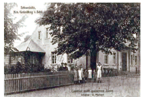
Fot. 6. Restauracja „Pod złotą gwiazdą” kiedyś

Lesław Wilczyński Fotografie i widokówki pochodzą ze zbiorów L. Wilczyńskiego