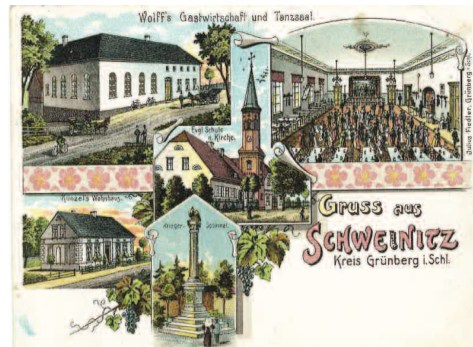
Fot. 9. W obecnym budynku Gminnego Ośrodka Kultury nawet przed wojną odbywały się imprezy taneczne, okolicznościowe i zebrania.