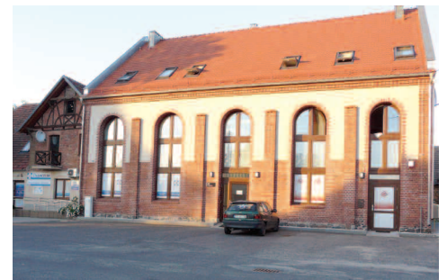
Fot. 3. W miejscu dzisiejszej przychodni znajdowała się restauracja „Pod czarnym orłem”

cowych, stały stoje z cukierkami, można było również napić się kawy i poczytać świeże wydanie zielonogórskiej gazety „Grünberg Wochenblatt”. Obecnie budynek ten pełni funkcję mieszkalną (fot. nr 4, 5).