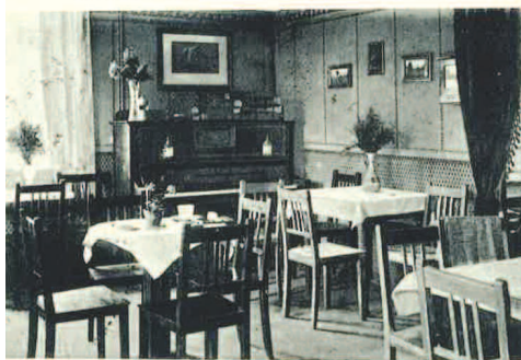
Gruß aus Schweinitz, Kr. Grünberg i. Schl.