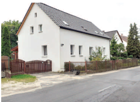
Fot. 5. Budynek mieszkalny, w którym znajdowała się cukiernia.

Świdnica znana była z kilku dobrych lokali gastronomicznych, w których oferowano rozmaite potrawy. Najbardziej znaną była restauracja „Gasthof zum Schwarzen Adler” (Pod czarnym orłem) (fot. nr 2, 3), której pierwszym właścicielem był Ferdinand Karrei, a po jego śmierci przejął go A. Klose. Obiekt funkcjonował przy dawnym skrzyżowaniu dróg Zielona Góra-Nowogród Bobrz. i Kożuchów - Krosno Odrz. (obecnie ul. Kosynierów z ul. Kościuszki). Budynek składał się z dużej sali tanecznej i mniejszej części jadalnej (obecnie apteka). Serwowano głównie dania mięsne, których świeże dostawy zapewniała ubojnia zwierząt prowadzona przez właściciela na zapleczu restauracji. Do gaszenia pragnienie podawano wyśmienite piwo Löwen Böhmisches Bier sprowadzane z berlińskiego browaru. Do dziś zachowała się oryginalna, metalowa reklama ścienna tego piwa odnaleziona przez autora na drzwiach jednej ze świdnickich stodół służąca jako