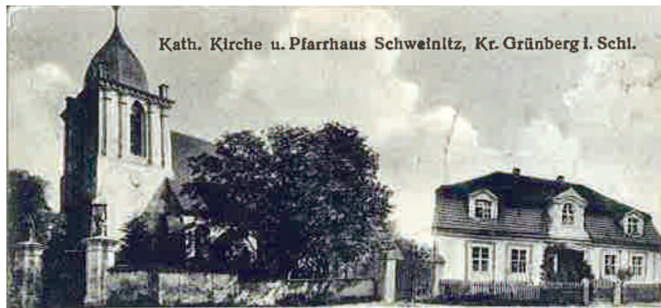
Kath. Kirche u. Pfarrhaus Schweinitz, Kr. Grünberg i. Schl.