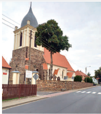
Obecnie kościół pw. św. Marcina.

Na małej wysepce przed świdnicką apteką rośnie sobie dąb. Ale nie jest to taki zwykły dąb. To już kolejne drzewo posadzone w tym miejscu na pamiątkę pierwszego świdnickiego kościoła pod wezwaniem Najświętszej Marii Panny, który stał w tym miejscu. Wybudowany w XIV wieku na planie prostokąta z masywną wieżą, a do jego