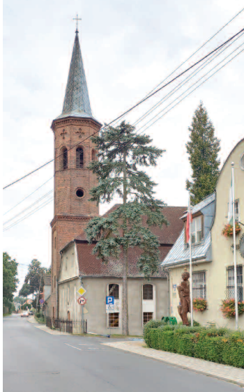
Obecnie kościół pw. Najświętszej Marii Panny Królowej Polski.

Obecnie w Świdnicy są dwa kościoły, oba przy ul. Długiej. Ale pierwsza świątynia stała w zupełnie innym miejscu.