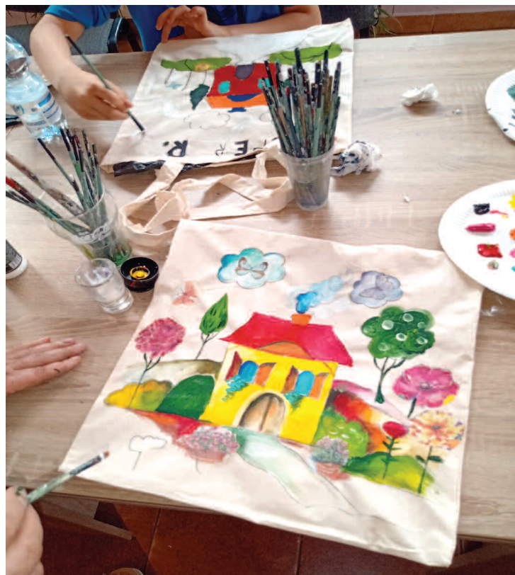
Takie cuda powstają podczas zajęć warsztatowych.