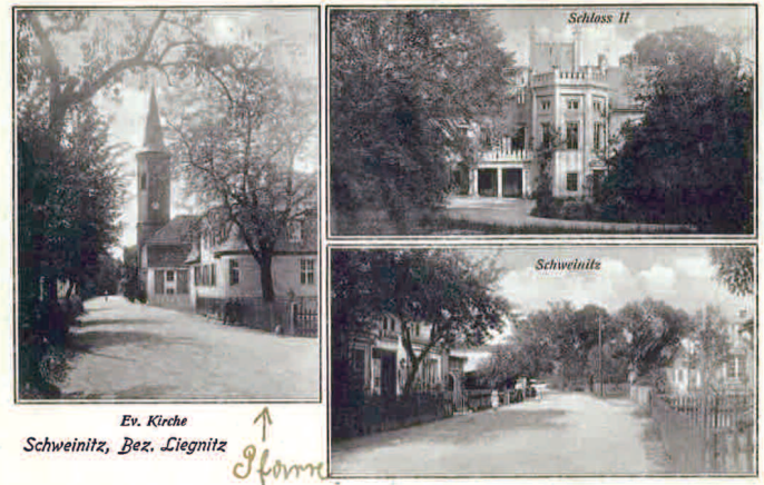
Kościół pw. Najświętszej Marii Panny Królowej Polski.