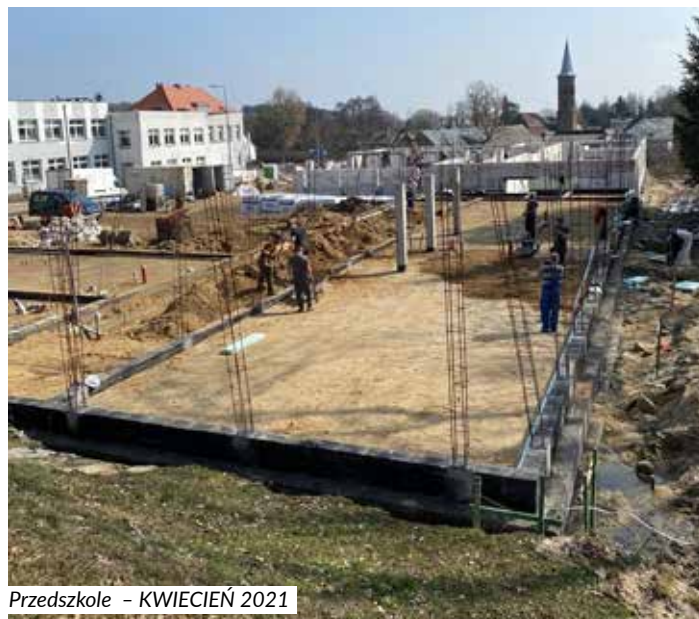
Przedszkole - KWIECIEŃ 2021