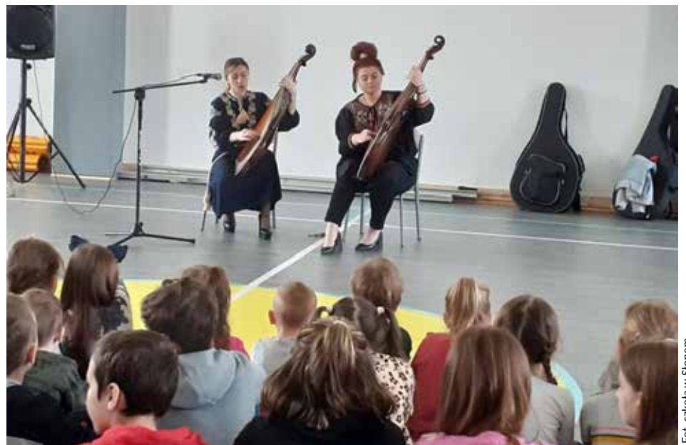
Fot. szkoła w Stonem