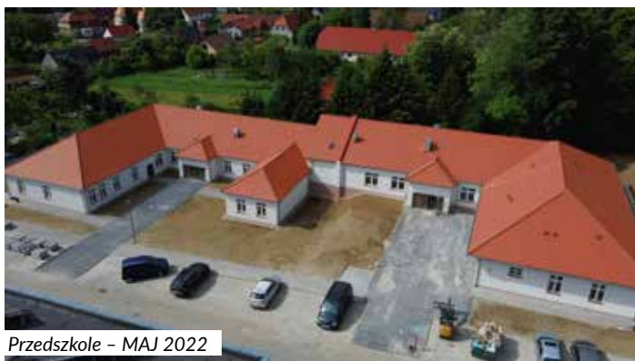
Przedszkole - MAJ 2022