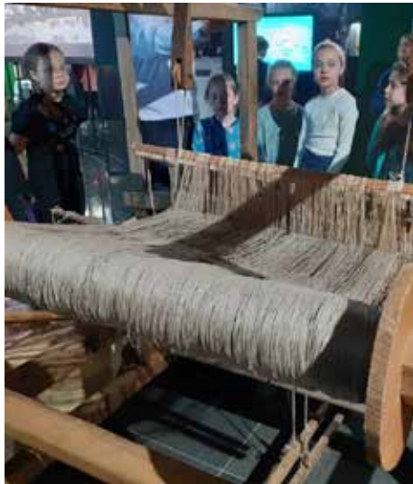
Fot. szkoła w Stonem