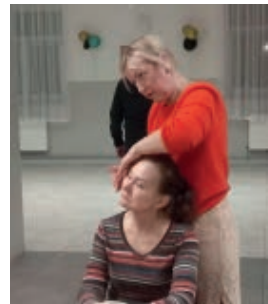
Wieczorny Rytuał Piękna

nym Rytuał Piękna – warsztatach pielęgnacyjnych twarzy. Przed nami jeszcze spotkanie z nauki makijażu i masażu twarzy.