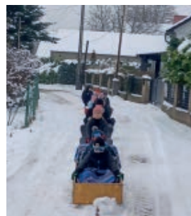
Kulig w Grabowcu