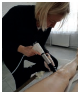
Akustyczna fala uderzeniowa

- Panie z KGW i mieszkanki naszej gminy uczestniczyły w Wieczor-