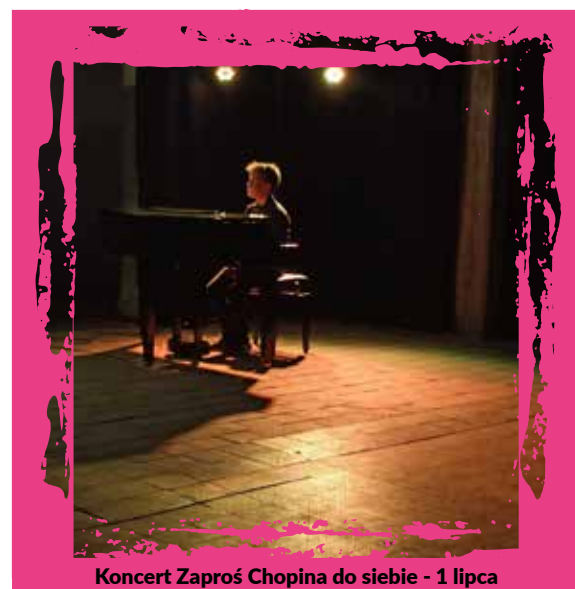
Koncert Zaprosz Chopina do siebie - 1 lipca