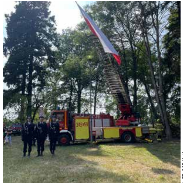
27 sierpnia - Obchody 75-lecia OSP Świdnica oraz OSP Koźła