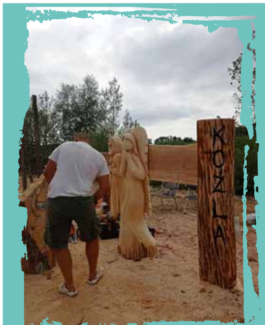
Polsko-niemiecki plener rzeźbiarski – 21-24 lipca Wydarzenie dofinansowane ze środków Europejskiego Funduszu Rozwoju Regionalnego i programu współpracy INTERREG VA Niemcy (Brandenburgia) – Polska (Lubuskie) w ramach celu „Europejska Współpraca Terytorialna”.