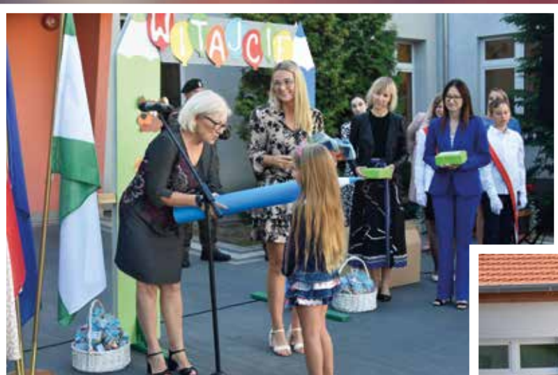
Rozpoczęcie roku szkolnego w Zespole Szkolno-Przedszkolnym w Świdnicy

Festyn integracyjny w przedszkolu w Świdnicy