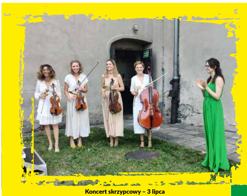
Koncert skrzypcowy – 3 lipca