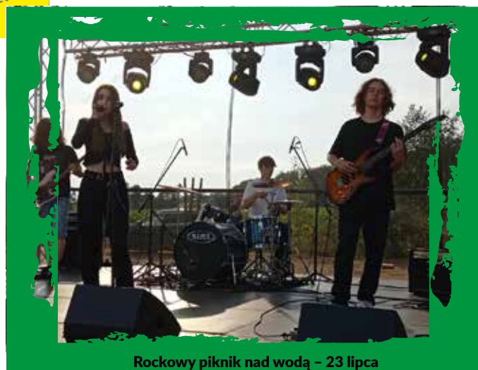
Rockowy piknik nad wodą – 23 lipca