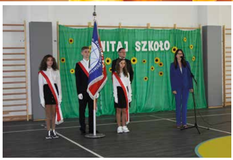
Rozpoczęcie roku szkolnego w Szkole Podstawowej w Słonem

WRZESIEŃ 2022 | NUMER 6/2022 (35) | www.swidnica.zgora.pl | e-mail: redakcja@swidnica.zgora.pl | ISSN 2657-4454