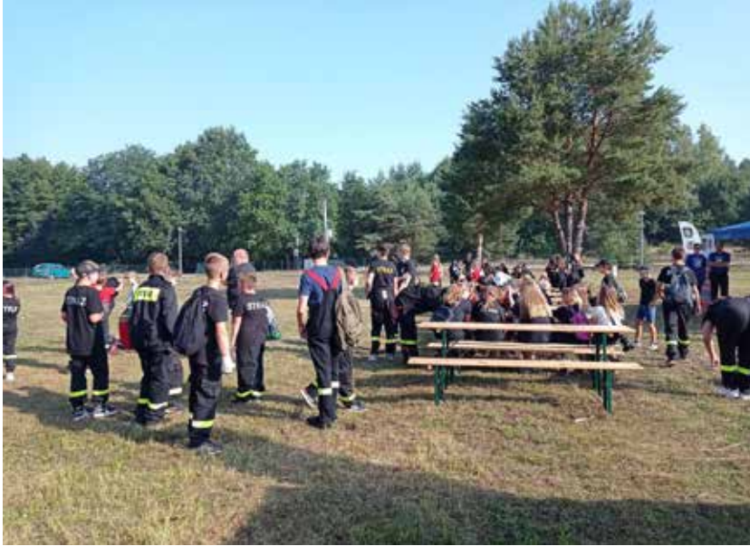
26 sierpnia - XIX Turniej Drużyn Młodzieżowych OSP powiatu zielonogórskiego pod hasłem „Chroń las i środowisko przed pożarem i zanieczyszczeniami” – drużyna OSP Koźła zajęła II miejsce