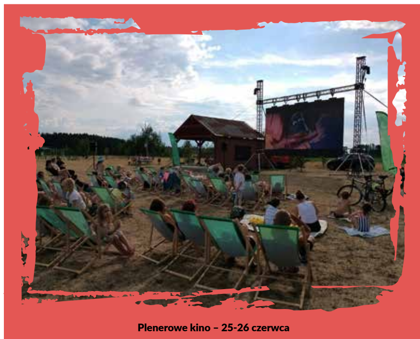
Plenerowe kino – 25-26 czerwca